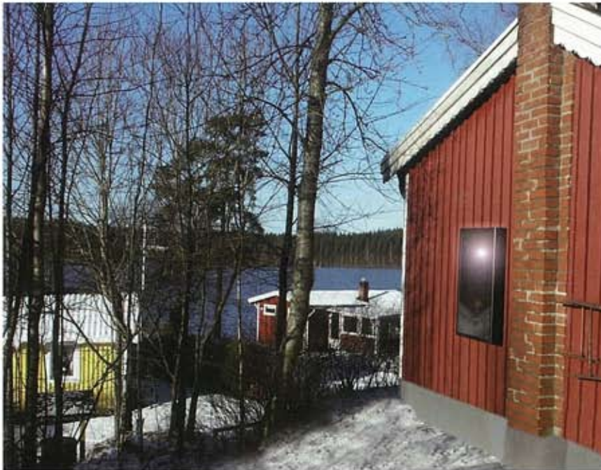
SolarVenti SV7 på gaveln till detta trähus håller det friskt och torrt.

Aidt Miljø A/S grundades 1981 med produktion av vätske solvärmeanläggningar och har sedan 1985 framställt luftsol-värmeanläggningar, i synnerhet till fritidshus- och stugor. Dessa har visat sig ha ett mycket stort användningsområde, ända från Spanien i söder till Grönland i norr, och från Irland i väster till Nya Zeeland i öster. Under 2006 har namnändring skett till SolarVenti A/S .